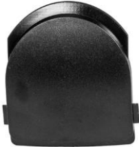
Imuaukon kansi / Insugslock