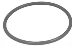
O-rengas / O-ring