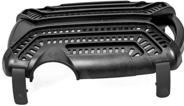
Pumppukotelon yläosa / Pumpkåpa - topp