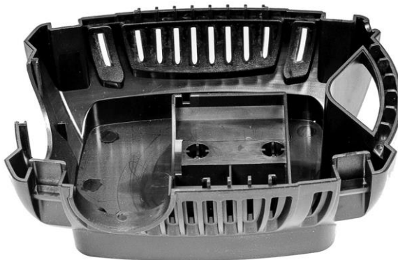
Pumppukotelon alaosa ja pumpun jalusta / Pumpkåpa - Boten med pumpfäste