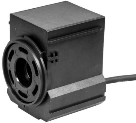
Pumpun moottori / Pumpmotor