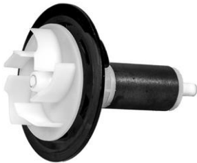
Roottori / Roottori