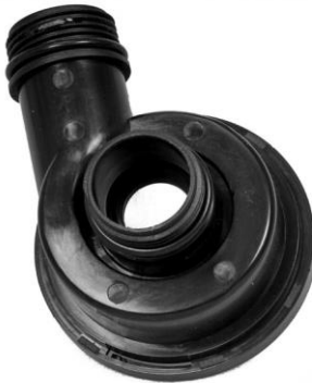
Roottorin kansi / Rotorlåg