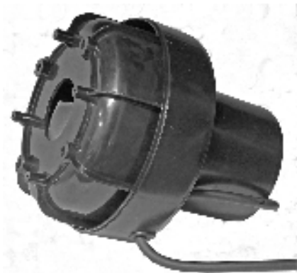
Rotorhus med påmonteret pumpehode Rotorhus med monterad pumpdel