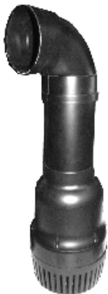
Komplet monteret Megaflow pumpe / Komplett monterad Megaflow pump