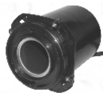
Megaflow pumpedel / Megaflow pumpdel