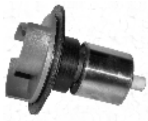
Rotor til Megaflow 55000 Eco / Rotor till Megaflow 55000 Eco