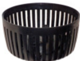
Filterkurv / Filterkorg