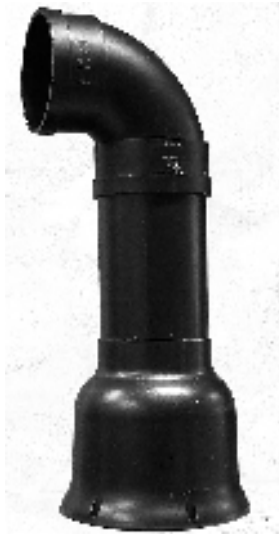
Komplet pumperør / Komplet Pumphør